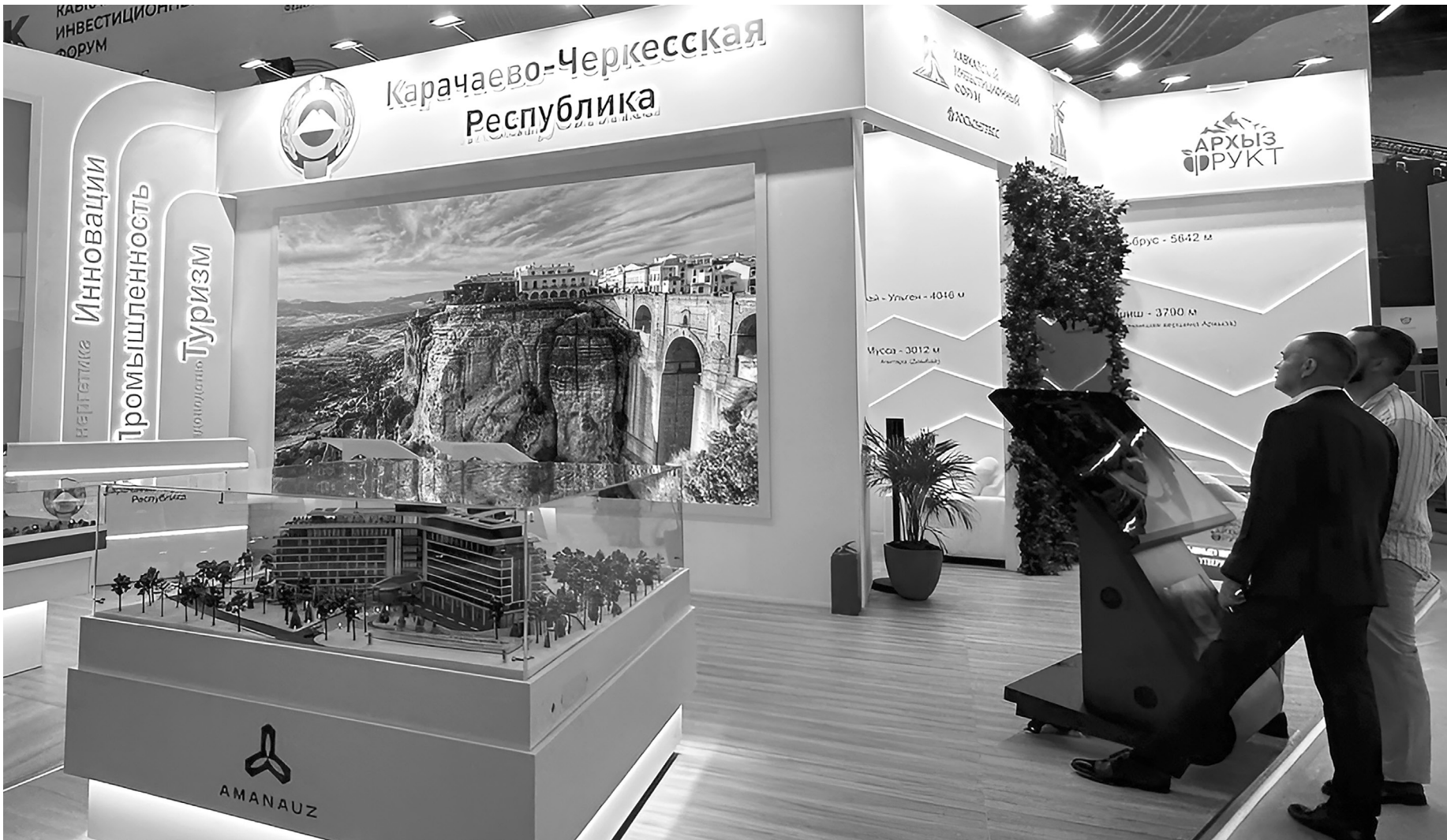
Участники форума знакомятся с экспозицией Карачаево-Черкесии

Ключевым объектом туристического развития республики стал проект 5-звёздочного круглогодичного бальнеологического отеля «Аманауз» в Домбае. Отель будет построен на высоте 1600 метров над уровнем моря и станет первым объектом такого класса в Домбае. Архитектура — в синтезе современно-