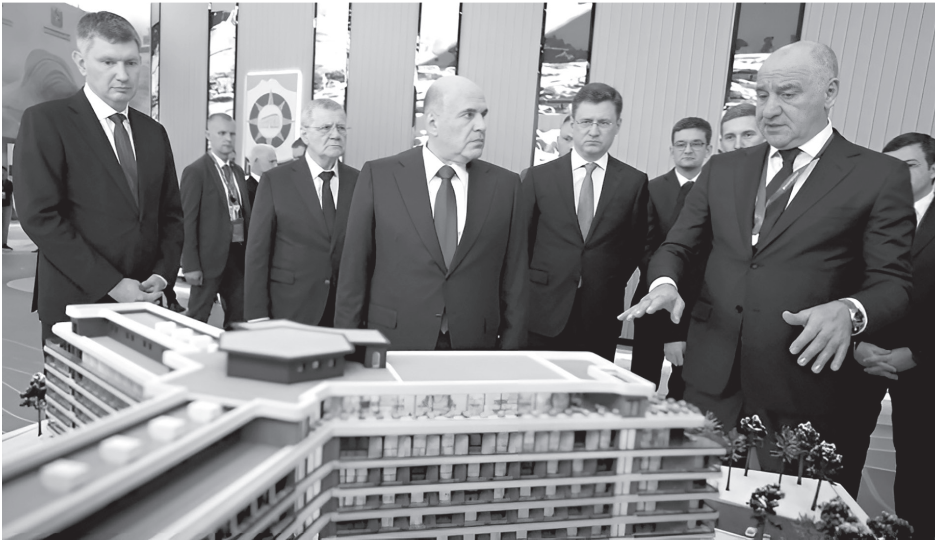
Рашид Темрезов знакомит Михаила Мишустина и членов Правительства РФ с инвестпроектами Карачаево-Черкесии

Форум стал точкой пересечения интересов, культур и капиталов. На панелях выступали губернаторы, министры, молодые стартаперы. Удивительно, но темы резонируют: от «умного АПК» до устойчивой энергети-