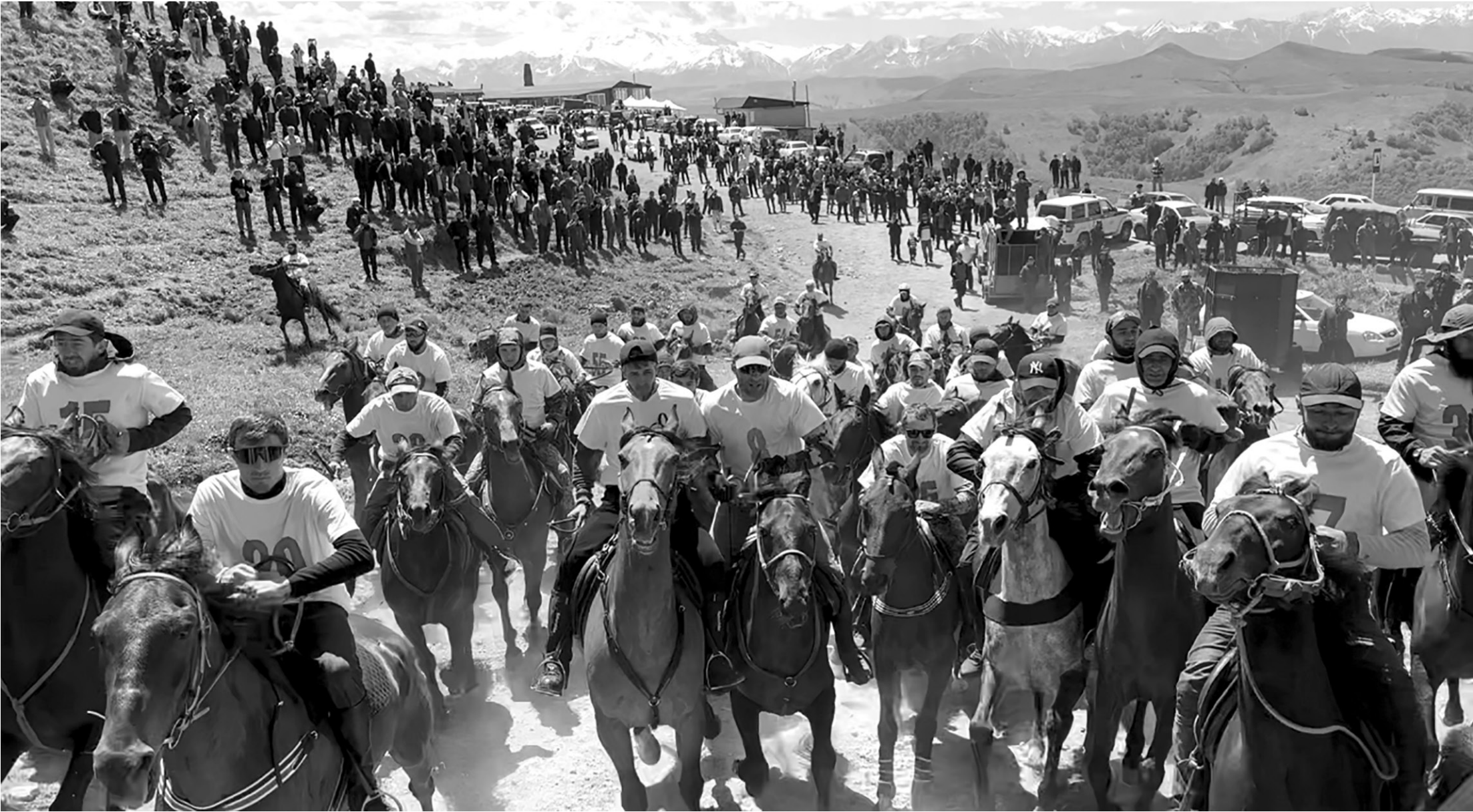
Масштабный конный пробег в Маринском ущелье украсил народный праздник